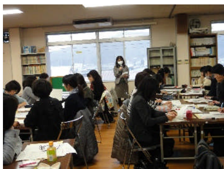
校種別交流会の様子