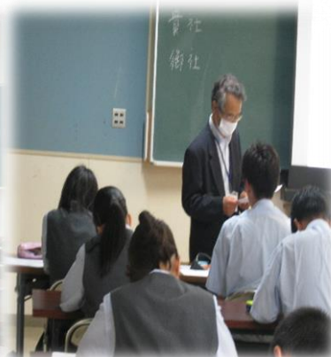
年間複数回行われる 進路ガイダンス