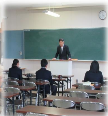
センター試験結団式