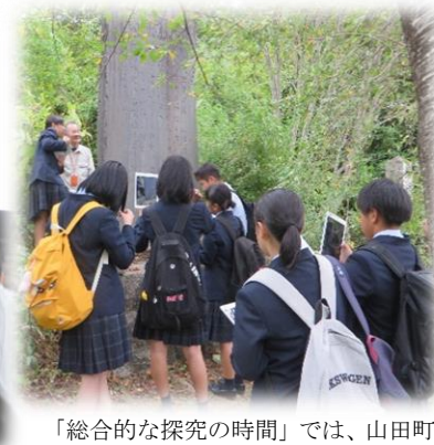
「総合的な探究の時間」では、山田町について調べ、自身の在り方生き方について考えています。