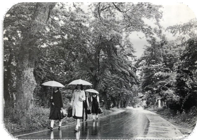
↑ さいかち並木「山田高等学校五十年史」より

また、昭和50年に創立50周年を記念し、これまでの文化祭の名称を「さいかち祭」とし、今日まで脈々と受け継がれています。