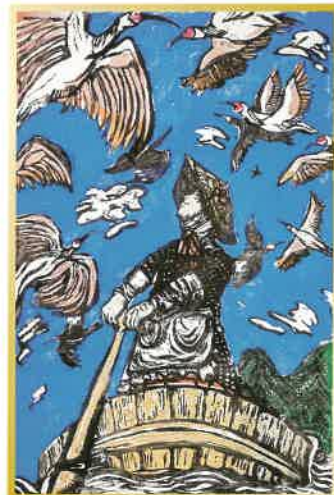
第22回 全国高等学校版画選手権大会 文部科学大臣賞受賞作品*2