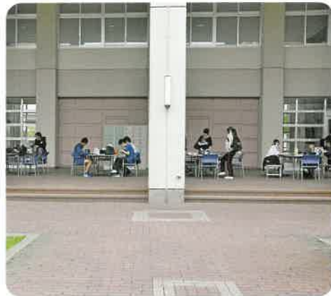
ピロティ風景（昼休み）