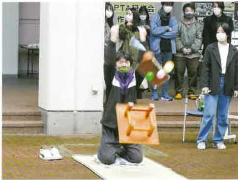
杜高祭「ちゃぶ台返し選手権」

〒020-8543 岩手県盛岡市上田二丁目3番1号 TEL (019)652-1813 (事務室) TEL (019)652-1814 (定時制) TEL (019)652-1123 (通信制) FAX (019)652-0195 (共通)