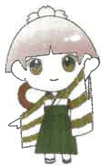
杜陵高校百周年 記念マスコット とりよんちゃん