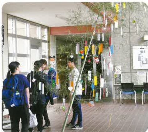
玄関ホール風景（7月7日）

杜陵高校は、生徒一人ひとりの課題に対応する教育を実践し、個を生かす丁寧な指導を行うとともに、 学びをとおして未来に向かって成長しようとする生徒諸君を支援 していきます。また、生徒と保護者、地域の皆様のさらなる期待に応えるために、生徒が明るく生き生きと学べる学校であること、生徒一人ひとりの成長と 夢を叶える学校 であることを目指していきます。