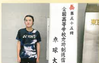
全国定通大会(卓球)