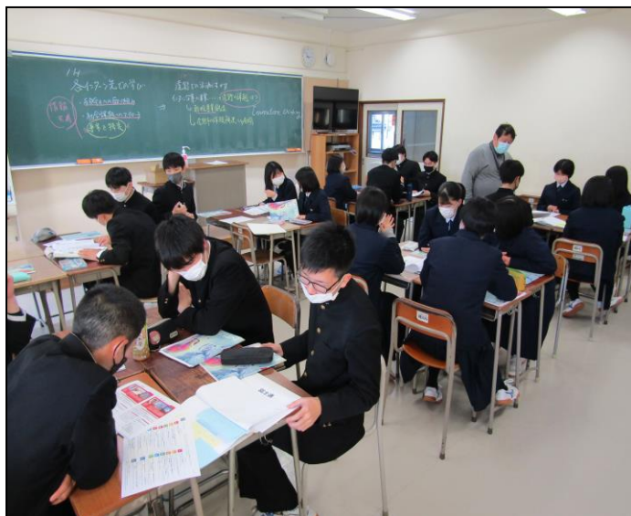
『みんなの未来探究コース』ゼミ