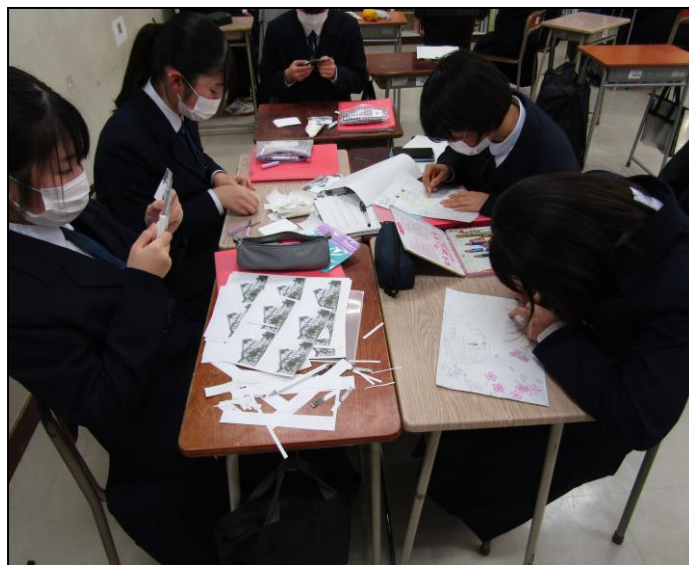
『未来の遠野物語』ゼミ