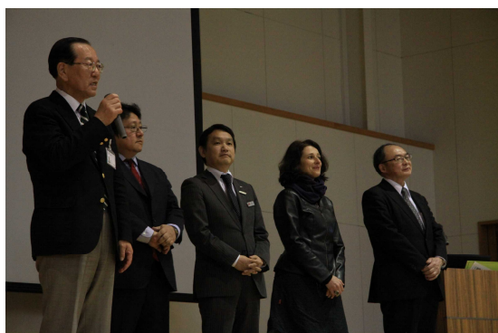
新しい『遠野物語』 を創るプロジェクト 開講式 (H29. 4. 25)