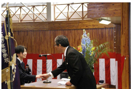
入学式 (H29. 4. 7)