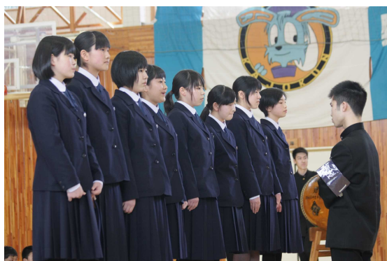
新入生歓迎会 部紹介 (H29. 4. 10)