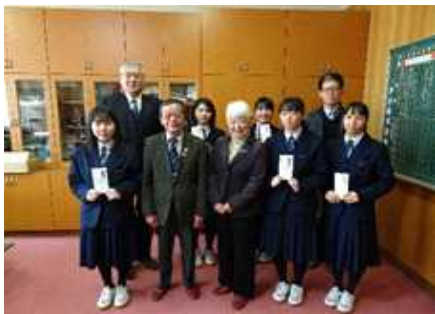
台湾派遣生徒 同窓会支援事業