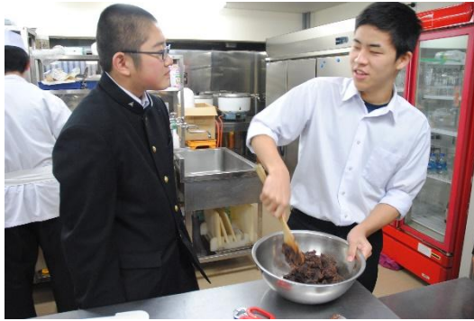
1年生はどら焼きを作ります。 「がんばってるね」「手伝えよ」

10月23日(火)、遠野P探究7回目が行われました。 商品開発チームは本日もたかむろ水光園さんにお邪魔しました。