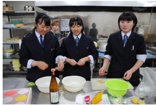
2年生はどぶろく入りたこ焼き!! を作ります。 「材料は目の前にそろいました。さて・・・」