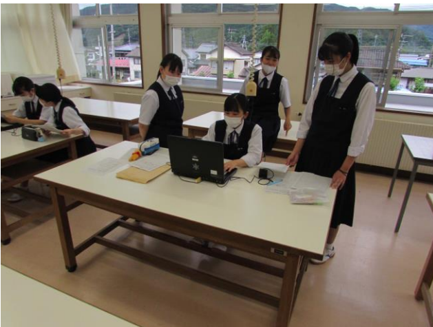
(遠野地域の食生活改善) ゼミ