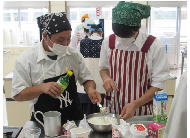
(遠野市とジンギスカン) ゼミ