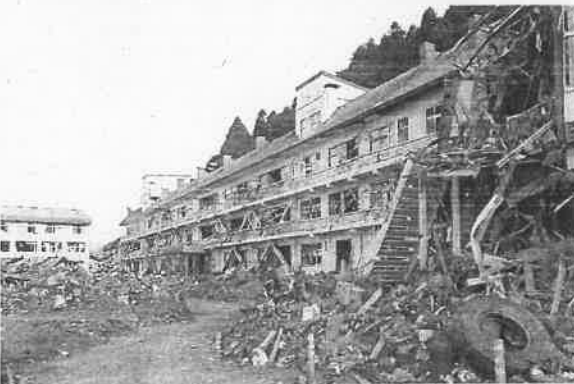
津波の直撃を受け、全壊した高田高校旧校舎＝2011年4月8日