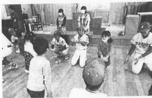
保育所で野球の楽しさを伝える高田高校の野球部員たち。2019年3月15日、陸前高田市

「ボールはこうやって投げ るんだよ」「バットを振って みよう」。今年1月8日、陸 前高田市の小友保育所に高田 高校の野球部員が訪れた。昨