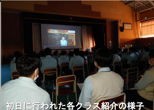
初日に行われた各クラス紹介の様子

初日は校内だけでの開催で、二日目は三年ぶりの一般公開となりました。新型コロナウイルス感染症対策として、生徒の家族だけに限定しての公開となり、来校いただく人数も二名以内という制限下で行われました。他にも生徒の飲食ブース開設の自粛や、生徒が1か所に密集しないようリモート環境を活用して会場を分散させる等の感染防止対策をとったうえでの開催となりました。