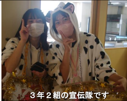
3年2組の宣伝隊です