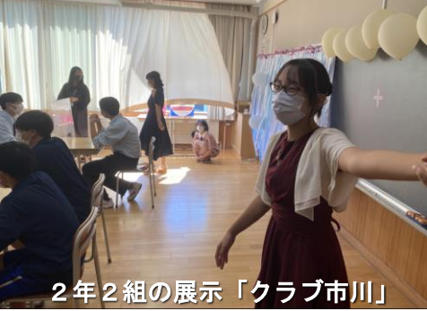
2年2組の展示「クラブ市川」

め、パソコン部によるeスポーツ体験、美術部による黒板アート等様々な発表がなされました。