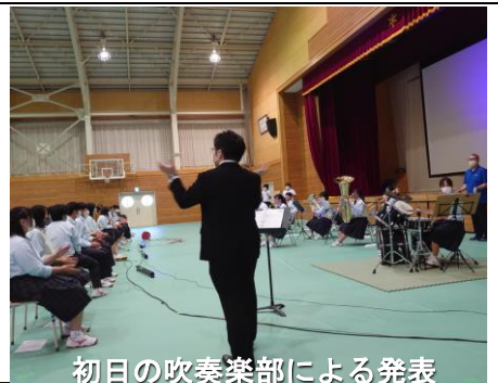
初日の吹奏楽部による発表

生徒による発表は、第一体育館でのステージ部門と、校舎内の各教室等での企画展示部門に分かれて行われましたし、初日の夕方には参加希望生徒による中夜祭も行われました。