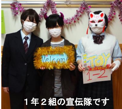
1年2組の宣伝隊です