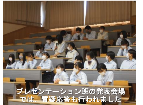
プレゼンテーション班の発表会場では、質疑応答も行われました

進めてきた探究活動の成果を発表するために発表会が行われました。当初は、この日にプレゼンテーション班とポスター発表班の発表が行われる予定でしたが、十一日にプレゼンテーション班、十三日(火)にポスター発表班と、二日間に分けての発表になりました。