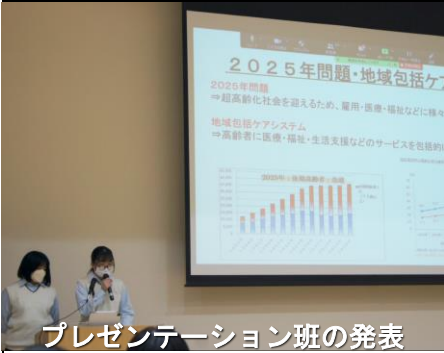
プレゼンテーション班の発表