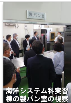
海洋システム科実習棟の製パン室の視察