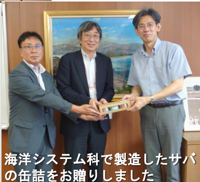
海洋システム科で製造したサバの缶詰をお贈りしました