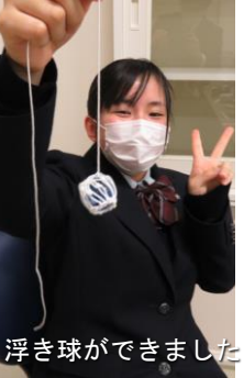
浮き球ができました

この日、「ものづくりチーム」は、広田湾の海水を利用した塩づくりと、浮き球づくり、市の地域産品であるリングを用いて製作する予定のジュースやジャムの名前付けやラベルのデザインに分かれて活動しました。