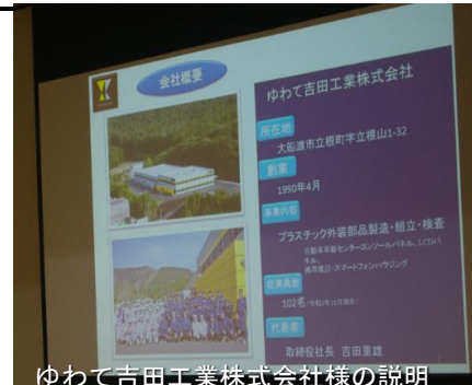
ゆわて吉田工業株式会社様の説明

この「出前授業」は、気仙地区雇用開発協会様の主催事業で、気仙管内企業の事業概要や仕事の魅力を紹介するとともに、若手社員(本校の卒業生)から、具体的な仕事内容や、仕事をやるうえでの姿勢、やりがい、苦労や喜びなどを伝えていただき、生徒が進路選択する際の一助とすることを目的にしたものです。この「出前授業」では、