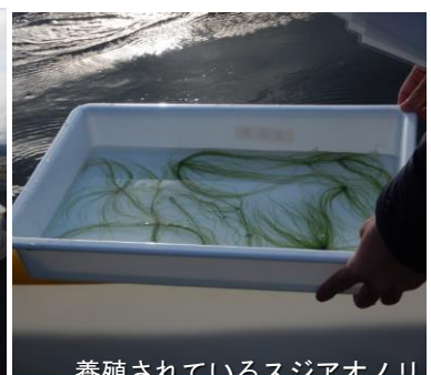
養殖されているスジアオノリ