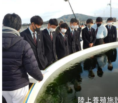
陸上養殖施設の様子

設を見学し、天候や海水温に左右されず、安定生産が見込まれる陸上養殖の生産技術について、多様化する水産業への理解を深めました。