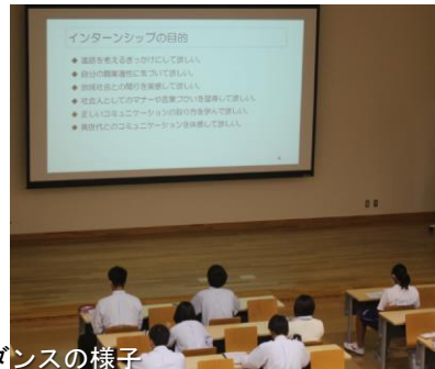
ガイダンスの様子