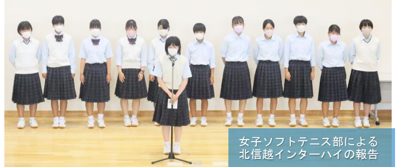
女子ソフトテニス部による北信越インターハイの報告

インターンシップに向けた事前ガイダンス 八月三十一日(火)の三・四校時、インターンシップ実施に向けた事前ガイダンスが、一・二学年の就職・専門学校進学希望者を対象に、シヨブカフェ気仙様から講師をお招きし開催されました。 当初の予定では、インターンシップを九月中旬に実施することにしていましたが、八月十二日(木)