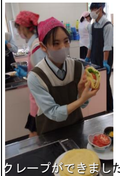
クレープができました