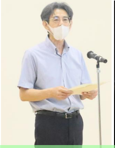
始業式での校長講話

中継アプリケーションを、これまでのZoomから変更したため設定が完了するまで少々時間を要しましたが、時間内に式と報告会を終えることができました。