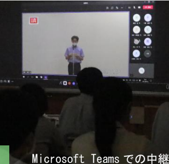
Microsoft Teams での中継

インターンシップに向けた事前ガイダンス 八月三十一日(火)の三・四校時、インターンシップ実施に向けた事前ガイダンスが、一・二学年の就職・専門学校進学希望者を対象に、シヨブカフェ気仙様から講師をお招きし開催されました。 当初の予定では、インターンシップを九月中旬に実施することにしていましたが、八月十二日(木)