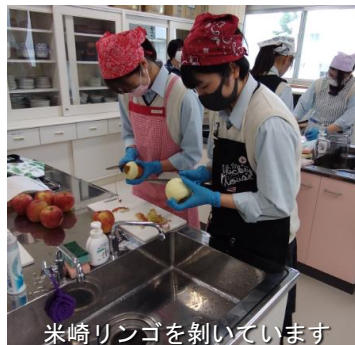
米崎リンゴを剥いています

地元食材を使用した調理実習 八月三十一日(火)の五・六校時、三年一組と三組の生徒により、地元食材を使用した調理実習が行われました。 この日の実習では、七月十三日(火)に開催された地元食材紹介講演会で学んだことをふまえて、夏休み中に各自が考えたレシピで、グループ毎にメニューを試作しました。 地元のフルーツを使用し、リンゴ飴やパフェ、クレープなどを作り、美味しく試食しました。 この調理実習も、「T×A c t i o n」の一環として行われました。