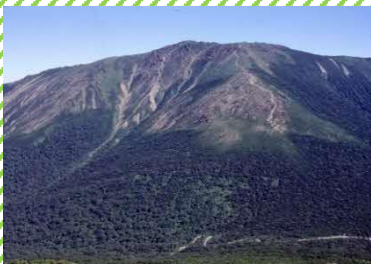
日本百名山 早池峰山

ぶどう栽培が盛んに行われ、県内有数のぶどう産地であり「ワインのまち」としても有名で、株式会社エーデルワインは、国内外のワインコンクールで数々の賞を受賞するワインを醸造しています。