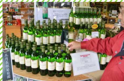
ぶどう・ワイン産業が盛ん!