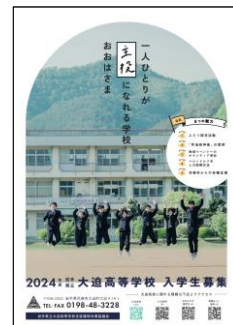
↑ R6 年度生徒募集ポスター