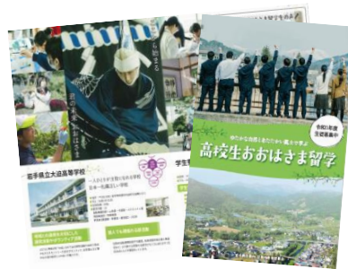
↑ 留学生募集パンフレット