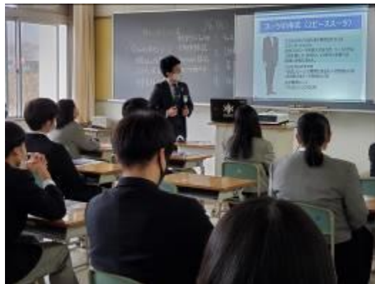
着こなしセミナー スーツの着こなしを学びました。

登校日には以下の講座を受講しました。 大人の仲間入りの気分になりましたね！ 10日（水）：金融セミナー 15日（月）：着こなしセミナー 22日（月）：税金セミナー これからは、身の回りのことを含め、自分で対応していくことが増えていきます。 頑張って大海を航っていこう！