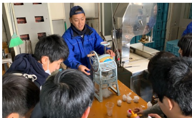
株式会社岡本製氷冷凍工場