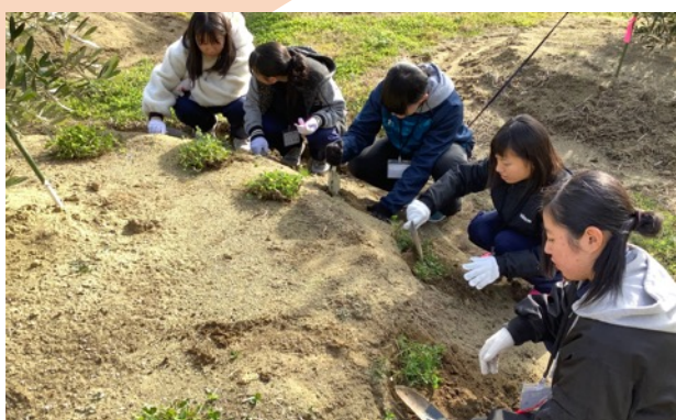
一般社団法人雄勝花物語