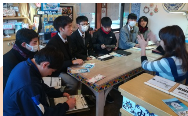
みなとまちセラミカ工房