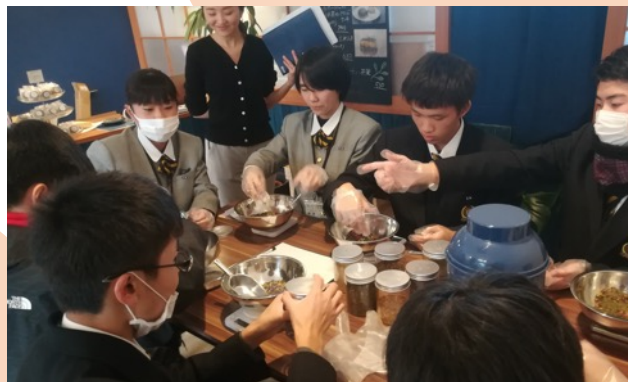
日本茶フレーバーティーOCHACCO

各地域で興味深い取り組みをたくさん見学することができました。生徒たちからは、「被災地であることや人口減少の問題など、大槌町と似ているところがあった」「新しい仕事を生み出すことによって町が活性化されていくことがわかった」といった感想がありました。