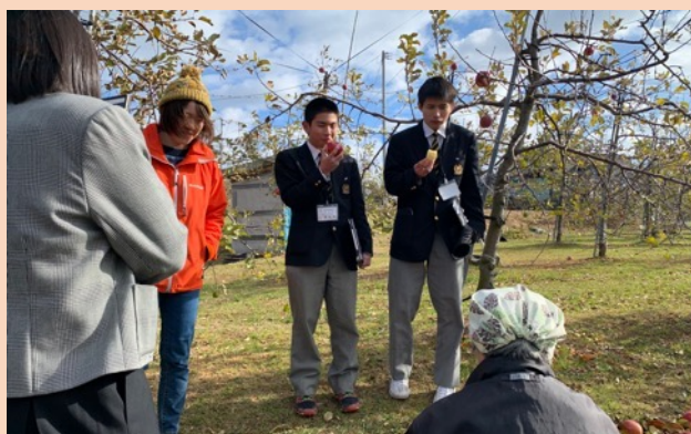
一般社団法人マルゴト陸前高田