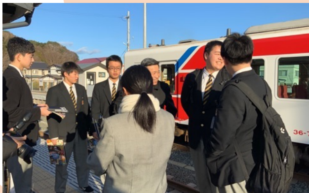
三陸鉄道株式会社