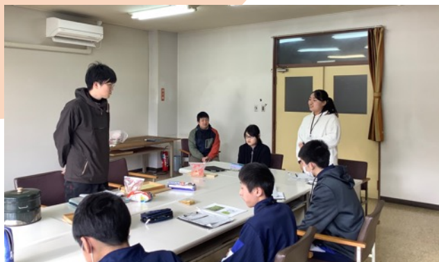
株式会社フォレストマーケティング