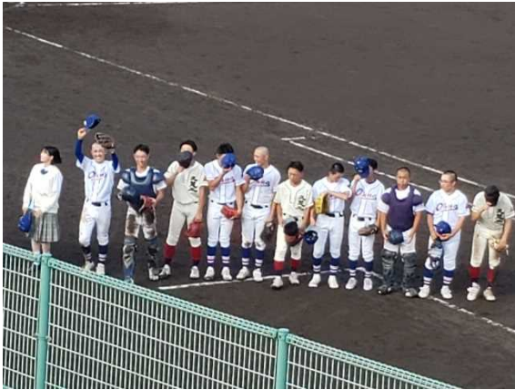
1回戦勝利後の野球部員

第105回全国高等学校野球選手権記念岩手大会 1回戦 対江南義塾盛岡 2対0で勝利 2回戦 対水沢第一高校 0対10で敗退