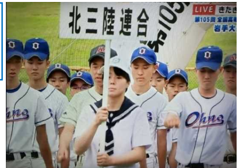
堂々と行進する野球部員