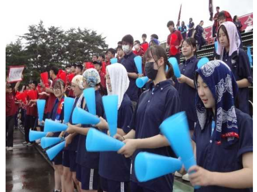
雨の中、一生懸命応援する生徒たち