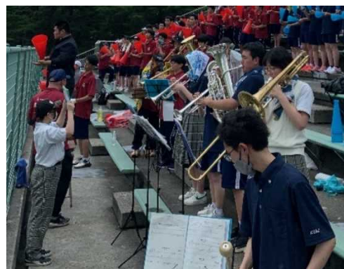
野球応援を盛り上げました。