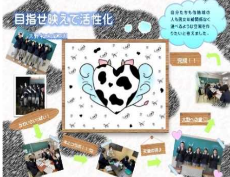
情報発信班のインスタはこちら