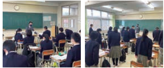
8時55分、一日のスタートです！