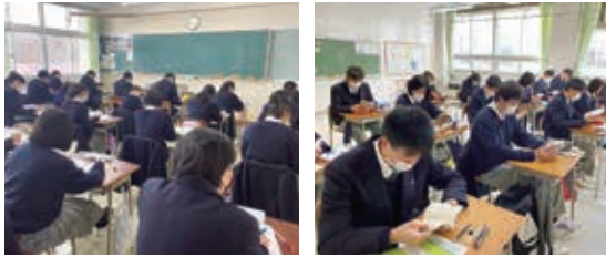
朝の10分間の学習・読書。朝から集中！