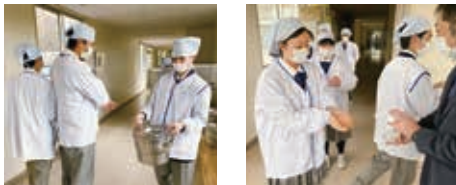
昼休みは給食準備から始まります！