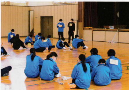
新入生研修(グループワーク)

何かと不安も多い高校入学直後。グループワークを通して、出身中学校の違う生徒とも関わるきっかけとなります。高校生活を送っていくうえでのコミュニケーションスキルを身につけます。