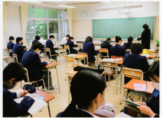
進学コース 授業風景