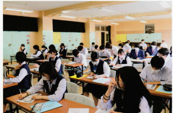
マナーアップ講座