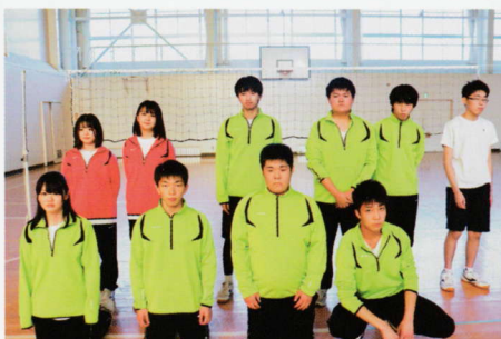
スポーツ・レクリエーション部