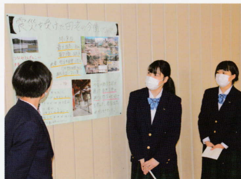
月例集会「宮北の森」