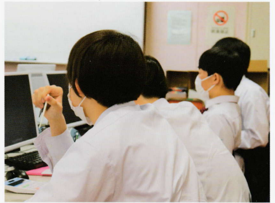
ビジネスコース 授業風景