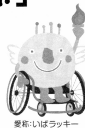
愛称:いばラッキー

10月12日(土)～10月14日(月)の3日間、茨城県において「いきいき茨城ゆめ大会2019 ～翔べ 羽ばたけ そして未来へ～」が行われます。6月1日(土)の岩手県障害者スポーツ大会の結果、本校からも二名の選手が参加しますのでご紹介します。