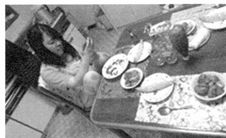
グループホームの生活の様子