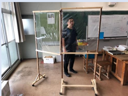
折りたたみ式パーテーション