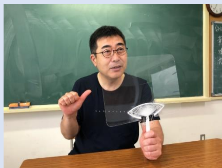
団扇型パーテーション