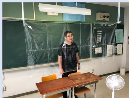
教室用パーテーション（中学部）