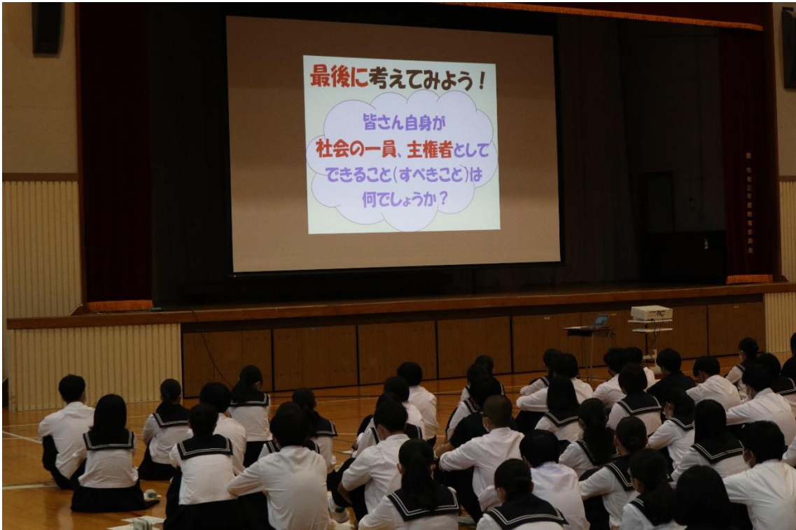
選挙は、国民の意見を反映させるのではなく、自分の意見を反映させるきっかけだ。