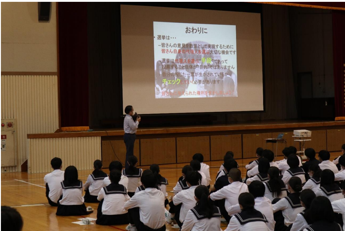
選挙が終わっても当選者が公約を本当に実行するかどうかを「チェック」する事がより重要である。