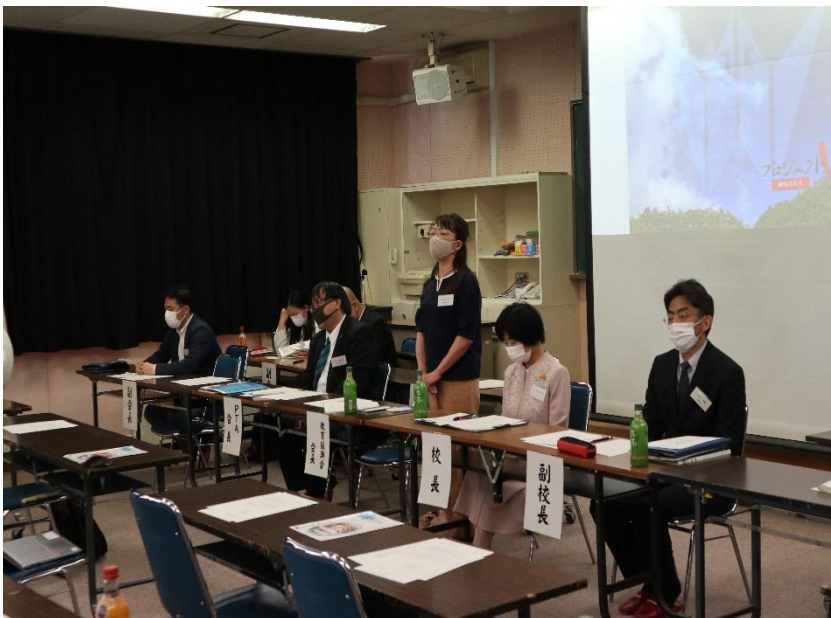
会長・副会長全景