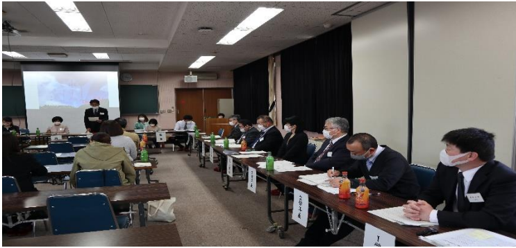
総務・教務・生徒・進路各課 長と1～3学年長