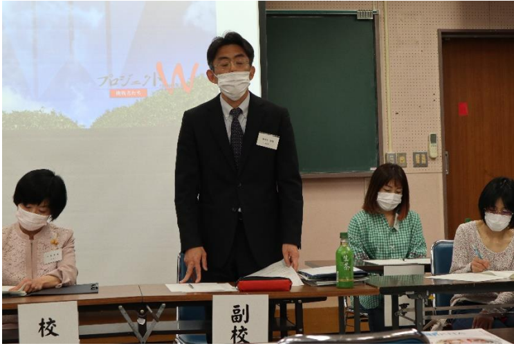
副校長 学校概況説明