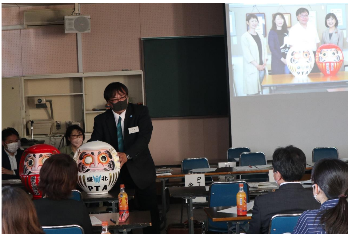
事業報告の補足説明（「PTAの白だるま」と「言葉の花束」・「言葉のはなみち」の紹介）