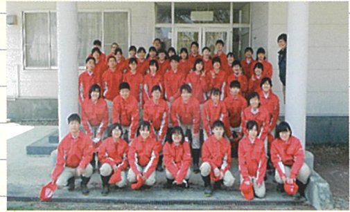
未来の後継者（令和4年度1年生 42名）

進路では、進学は動物系の国公立大学、私立大学、専門学校や農業大学校への進学が多く、獣医を目指す人もいます。就職では、県内の農業関連企業を目指す人が多く、県外の大規模な牧場に就職するチャレンジ精神たっぷりの人もいます。