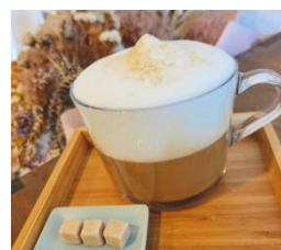
人気 No.1 カフェラテ