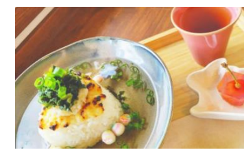
癒しの味 だしおにぎり