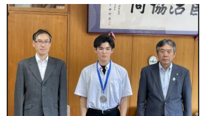
[7/18(火)上柿選手町長表敬]