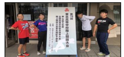
[陸上競技部 東北大会にて]