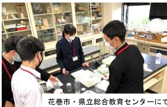
花巻市・県立総合教育センターにて

県立総合教育センターを会場に「科学の扉」が行われました。県内18校64名の高校生が参加し、本校より3名の生徒が参加し、物理と化学の講座を受講しました。「科学グランプリ」や「科学の甲子園」等で扱われた実験や問題を素材とした再現実験等が行われ、科学に対する関心・意欲を高めることができました。また、他校の生徒と同じグループで協力しながら実験を行うことで、科学に興味を持つ仲間として交流をすることができ、参加した生徒にとって大変刺激となった講座でした。