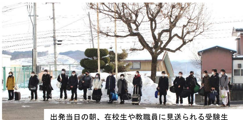
出発当日の朝、在校生や教職員に見送られる受験生

3年生15名が1月16日(土)・17日(日)に大学共通テストを岩手大会場にて受験しました。初日は地歴公民・国語・外国語、2日目は理科と数学です。これまで学んできた力を十分に発揮して目標点をとってほしいと思います。帰校後、18日には自己採点を行い、個別試験に向け再スタートを切りました。合格までの道のりはあと一息ですので、今後も応援をお願いいたします。