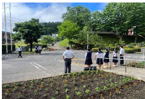
＜中高執行部あいさつ運動＞

今後については、9月「中高一貫クリーン作戦」、「軽高生と語る会」が計画されており、中学校と高校の交流が一層深まるものと期待されます。