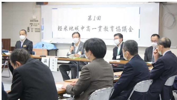
＜中高一貫教育協議会の様子＞

また、6月7日（火）には第1回軽米地域中高一貫教育協議会が軽米高校にて行われました。役員の選任や、令和4年度中高一貫教育実施計画の確認が行われました。質疑応答では沢山の意見が出され、活発な議論が交わされました。