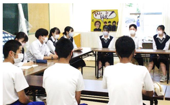
中高生徒会執行部交流会