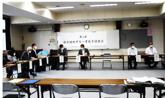
第1回 軽米地域中高一貫教育協議会

今後については、8月「先輩と語る会」、9月「中高一貫クリーン作戦」、12月には高校教員（理科）の出前授業による豚の眼球の解剖実験なども計画されています。部活動での交流等も実施されており、これからの交流がさらに活発になることが期待されます。