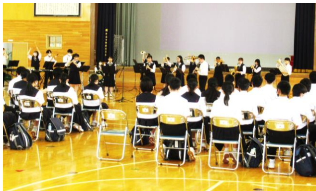
全体会での吹奏楽部発表