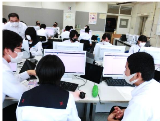
情報授業体験（プログラミング）