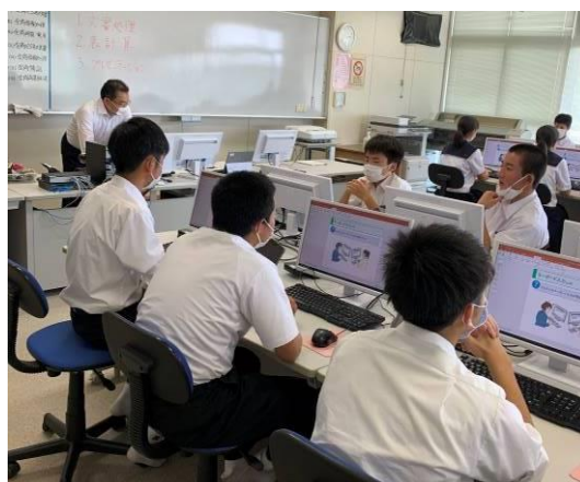
↑ 情報「ビジネス文書」体験授業の様子