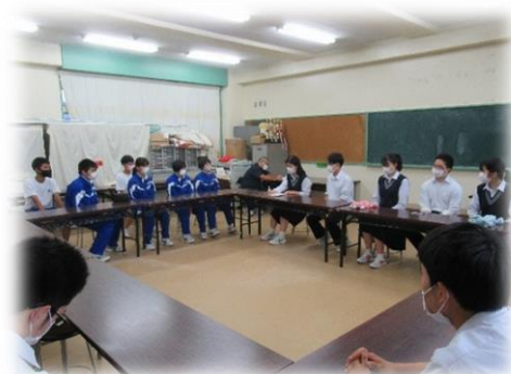
中高生徒会執行部交流の様子 R2.7.15

6月から数学の交流授業が始まり、生徒会執行部交流や合同での朝の挨拶運動も昨年に引き続き実施しています。夏休み明けから英語の交流授業も始まります。9月には中高一貫クリーン作戦や軽高生と語る会も計画しています。7月29日には地域支援者拡大会議を開催し、地域やPTA代表の皆様から、中高一貫教育への貴重なご意見をいただきました。