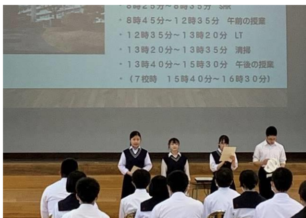
↑ 生徒会による学校紹介の様子（全体会）