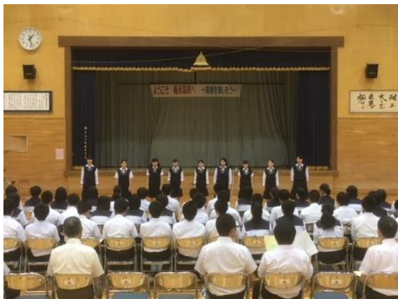
↑ 音楽部発表の様子（全体会）