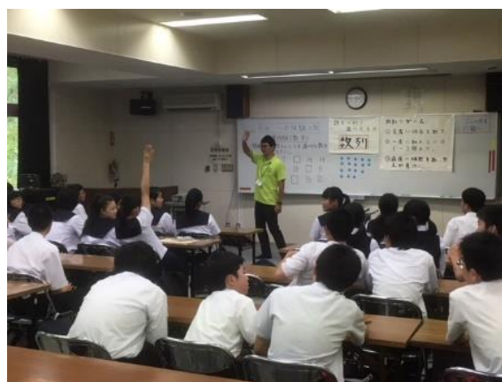
↑ 数学「数列」体験授業の様子