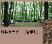
森林セラピー (岩手町)