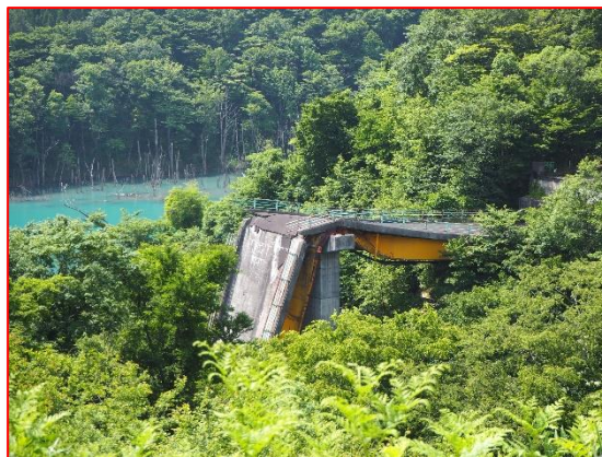
崩落した祭時大橋