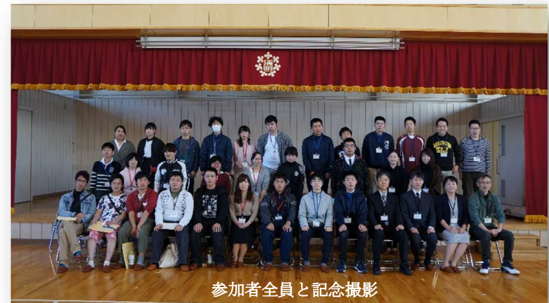
参加者全員と記念撮影

※たくさんのご意見ありがとうございました。今後の内容づくりの参考と致します。アンケートのご協力ありがとうございました。