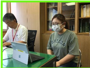
開会式は校長室からリモートしました。