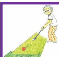
お母さんと一緒にスカットボールを楽しみました。