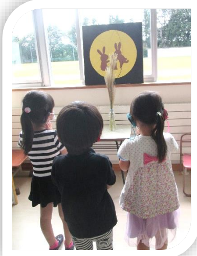
夜、お月様が見えますように!!