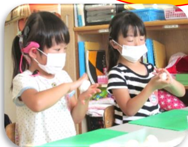
粘土を丸めて、お団子を作ったよ!!