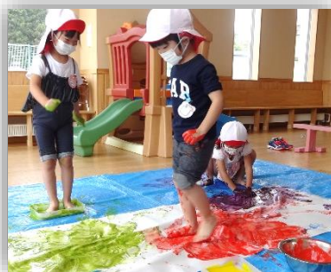
手や足に付けて、ペタペタ!!