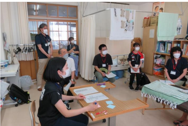
「グループ演習の様子」