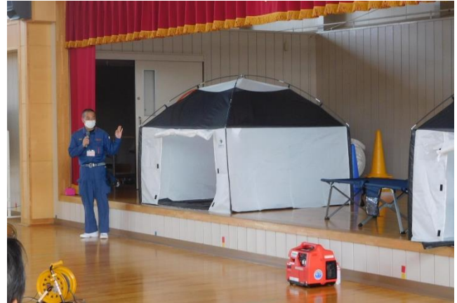
「一関消防本部さんからの災害時用の物品の説明」