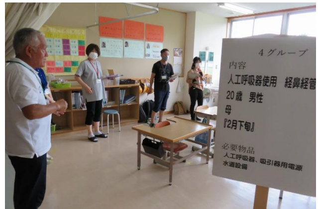
「グループ演習の様子」