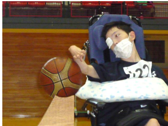
「フロアボウリング」