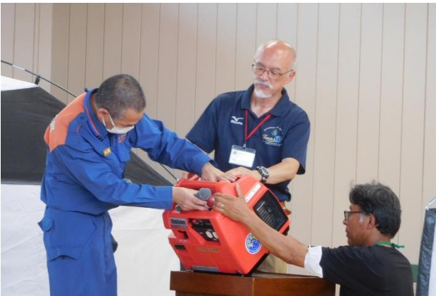
「一関消防本部さん：発電機の使い方」