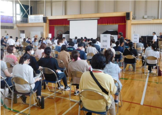
「管理班、情報班、食糧班、物資班等に分かれて開会」

7月25日（火）に令和5年度第2回学校運営協議会が開催されました。当日は、本校の福祉避難所設営訓練日であり、そこに運営協議会委員の方にも参加していただく形で実施しました。本協議会では、昨年度から「学校安全と防災」をテーマに協議を重ねてきており、今回は、訓練により、福祉避難所設営に向けて開設・運営方法について学び、演習を通して見つかった課題の把握と共有を目的に実施されました。