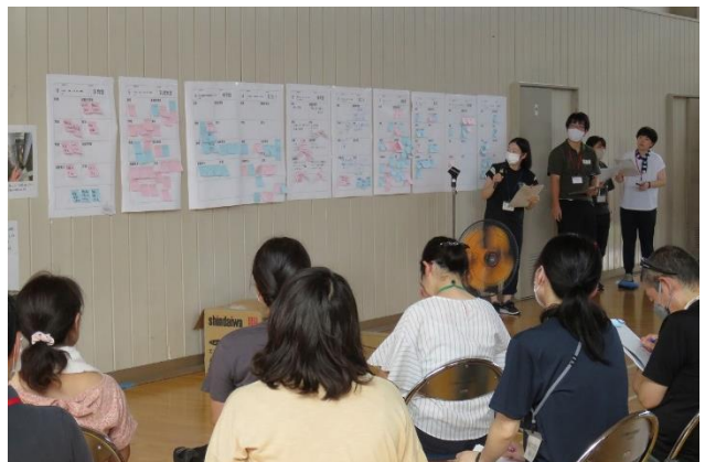
「グループごとの発表」