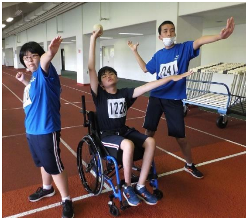
「ソフトボール投げチーム」