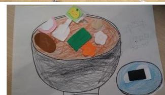
『お雑煮』 訪問学級児童作