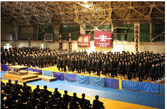
全員で乗り越えたぞ！