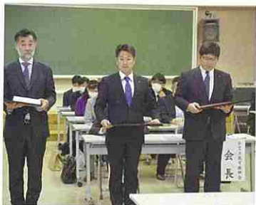
旧役員へ感謝状贈呈