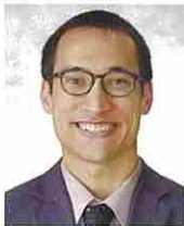
1学年付 スタイブンク ロフト