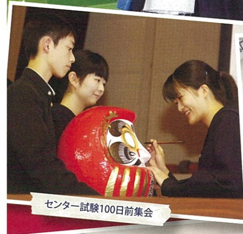
センター試験100日前集会