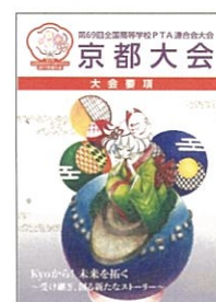
全国高P連京都大会