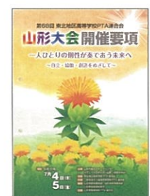
東北高P連山形大会