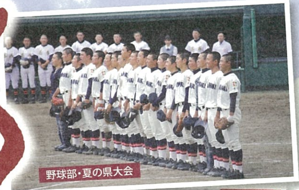
野球部・夏の県大会