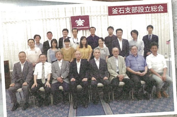
釜石支部設立総会