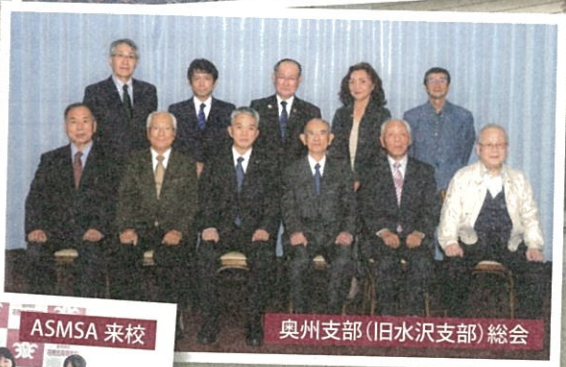
奥州支部(旧水沢支部)総会