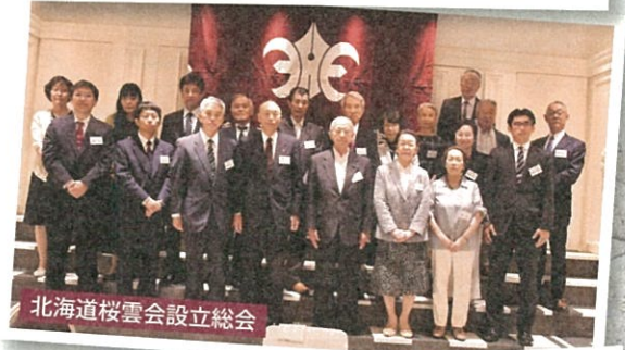
北海道桜雲会設立総会