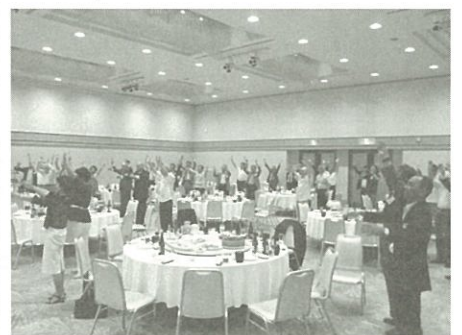
懇親会・万歳三唱