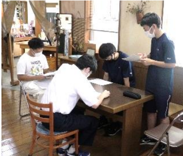
「古代米おりざ」様の協力をいただきながら、新メニューのブレゼンを行うグループ。

9月1日（木）の5・6校時に今年度2回目の探究活動を行いました。次の写真は、その時の様子になります。