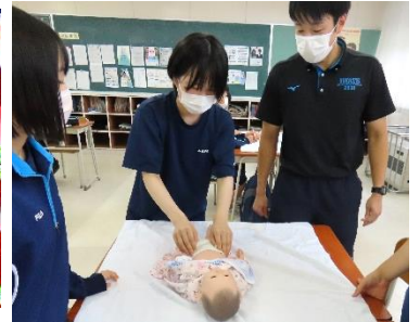
「北日本カレッジ」様、「一関青年会議所」様の協力をいただきながら、保育に関わる実践を行うグループ。