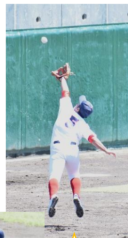
躍動する花高野球部！