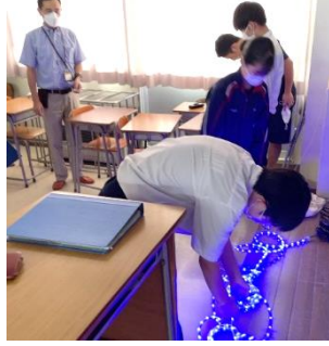
「花泉支所」様の協力をいただきながら、12月に行うイルミネーションの実施方法について考察するグループ。