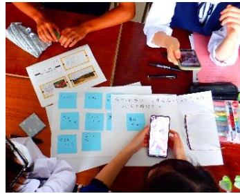
「花と泉の公園」様の協力をいただきながら、公園の活性化に向けたアイディアを付箋に書いて提案し合うグループ。