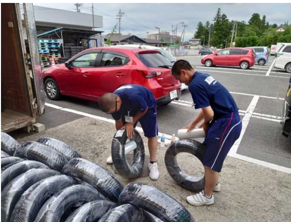
イエローハット築館店