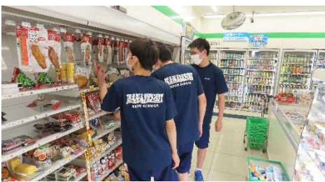
ファミリーマートフレンドボックス花泉店

ご協力いただいた事業所(順不同) 誠信堂医院小児科、介護老人保健施設華松苑、特別養護老人ホーム福光園、認定こども園わくつこども園、(株)真柄油脂店、日本端子(株)花泉工場、イエローハット築館店、丸江スーパー花泉店、菓子工房シェルブール、ファミリーマートフレンドボックス花泉店、ファミリーマート花泉金沢店、(株)斎藤松月堂、ユニクロ一関店、EARTH一関店、ネクサス一関店、ペットショップCOO&RIKU一関店、ペットワールドアミーゴ一関店、DCMホームック一関店、花泉図書館