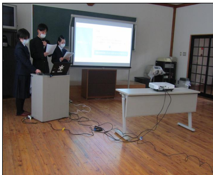
『地域遺産のデジタルアーカイブによる観光情報の高度化』ゼミ