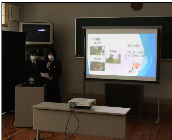
『遠高 Watching 制作』ゼミ

明日の発表（撮影）に向けて発表のリハーサル（2月24日（木））の活動の様子です。