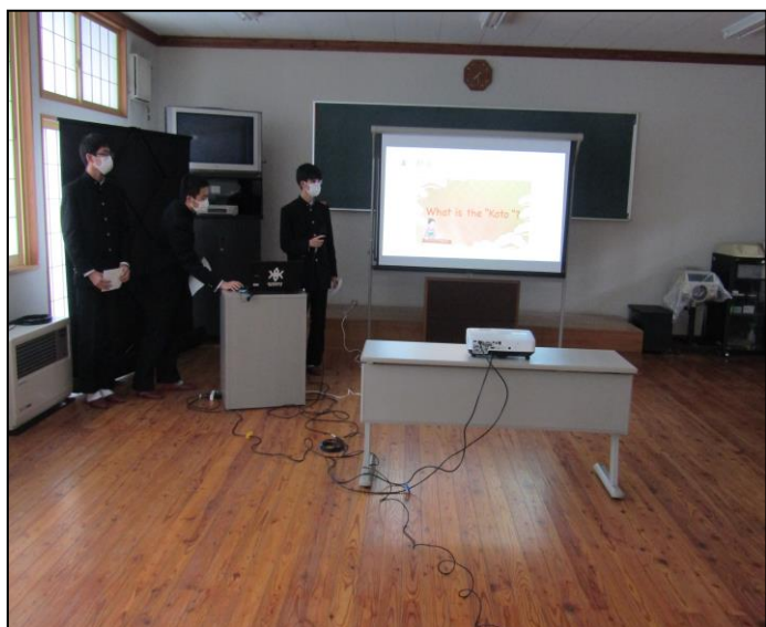
『これからの国際交流』ゼミ