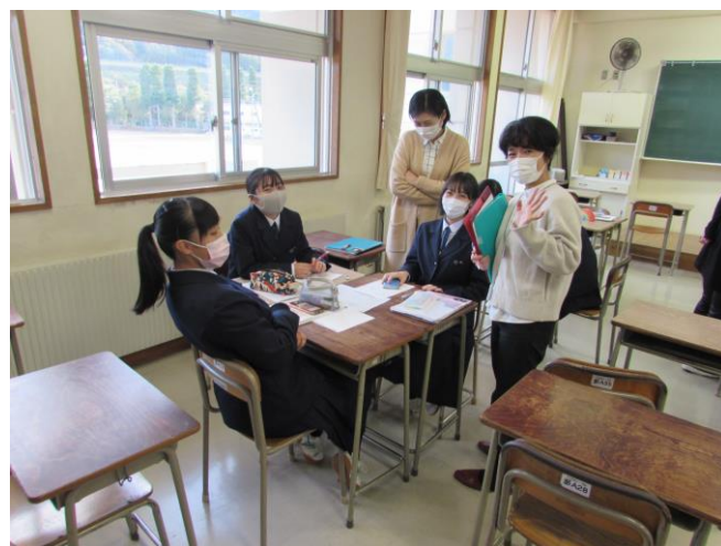
（外国人にやさしいまちづくり）ゼミ