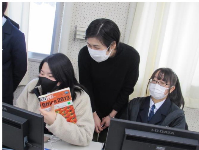
(外国人にやさしいまちづくり) ゼミ