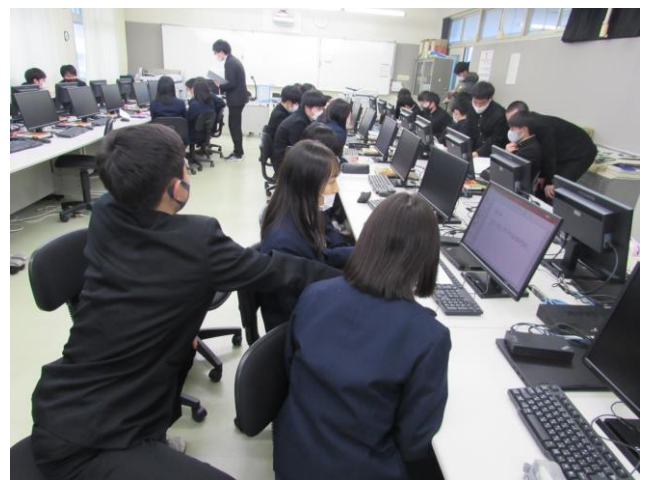
(情報処理室での様子)