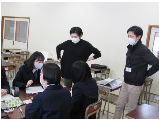
(外国人にやさしいまちづくり) ゼミ

いよいよまとめの段階となりました。1月19日（火）の活動の様子です。生徒達がパソコンで発表原稿を作成しているシーンが多くなりました。