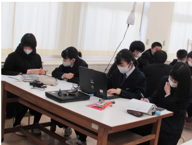
(遠野地域の食生活改善) ゼミ