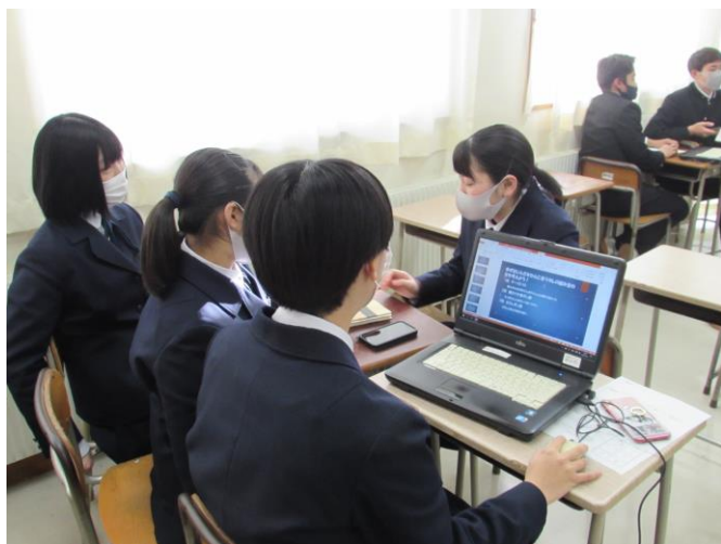
(遠野市とジンギスカン) ゼミ