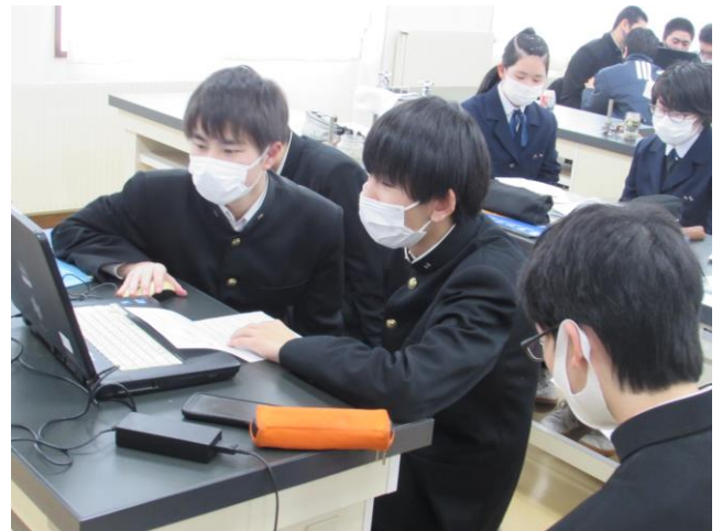
(遠野を自然科学の視点で) ゼミ