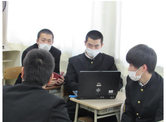
(遠野に生きる人達の今・昔) ゼミ